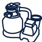
Groupe de filtration YZAKI 5,7m 3 /h